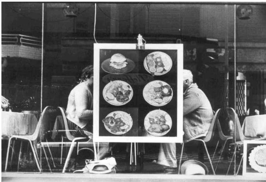
El poder de la imagen